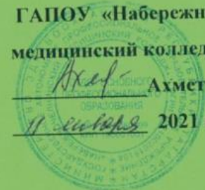
ГРАФИК ПРОХОЖДЕНИЯ УЧЕБНЫХ И ПРОИЗВОДСТВЕННЫХ ПРАКТИК НА 2020/2021 УЧЕБНЫЙ ГОД (2 полугодие)