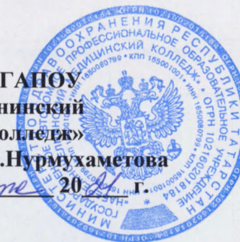
ГРАФИК ЦИКЛОВ НА 2022 ГОД